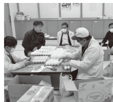
3月 愛の献血運動 (ふれあい健康センター内)