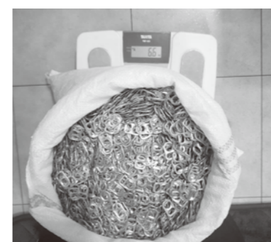
5月 プルタブ寄贈 (6.6kg)