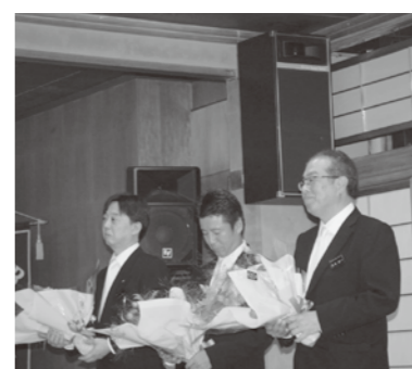
6月 さよなら例会 (三役交代) お疲れ様でした。