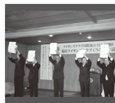
6月 さよなら例会 (永年勤続表彰)