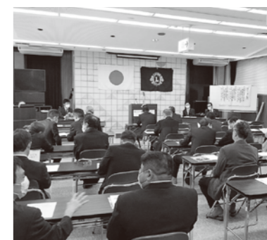
5月 コロナ自粛後初の例会 (鳳輪会館3F)