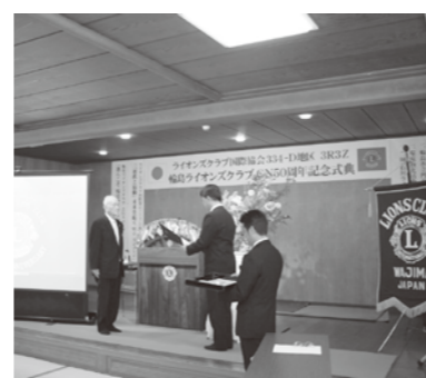
6月 50周年式典 (50年在籍表彰・清水ライオン)